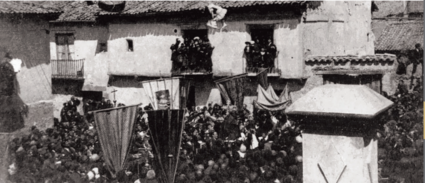
Imagen tomada durante la Bajada del Ángel de 1885 celebrada en la Plaza del Salvador

Fue declarada Fiesta de Interés Turístico Nacional en el año 2011.