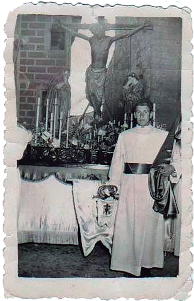
Imagen: Años 50

La Hermandad del Cristo de la Buena Muerte, tiene por titular la imagen más antigua, un cristo de la Buena Muerte del s. XIV. La Hermandad creada oficialmente en 1923, pero que contaba previamente, antes de sacarla en procesión, con una confraternidad de devoción de la que hay noticias desde 1858.