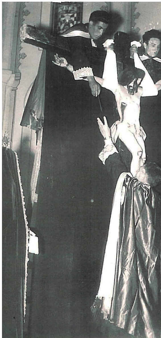
Imagen de 1960

Acto seguido se celebra la procesión general de las cuatro Cofradías.