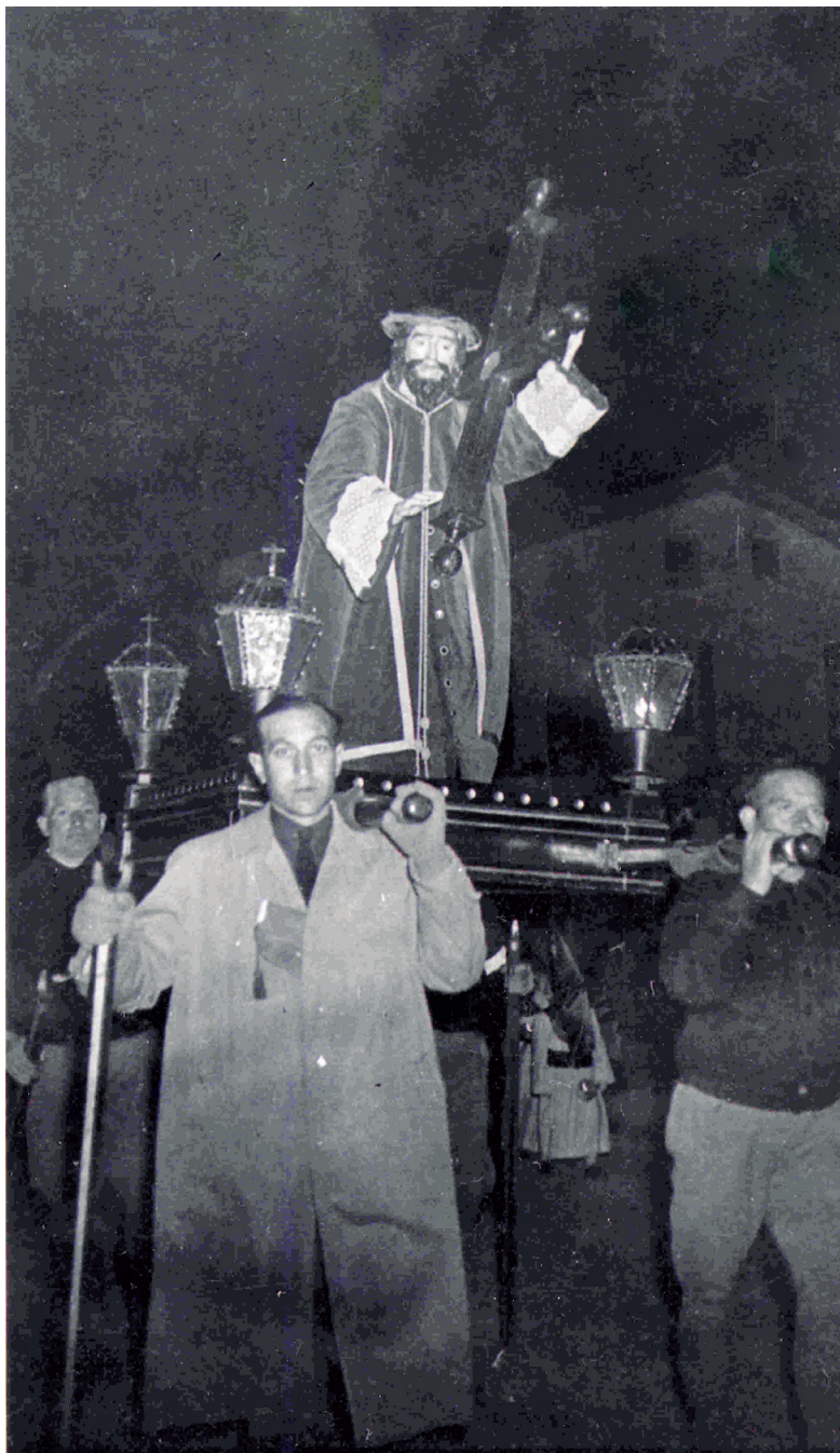
Imagen: Año 1954

Talla del Nazareno del s. XVII procedente del desaparecido Convento de San Francisco. Fue portado a hombros desde la refundación de la Cofradía en 1945 hasta el año 1954, ese año se adquiere la talla hoy titular.