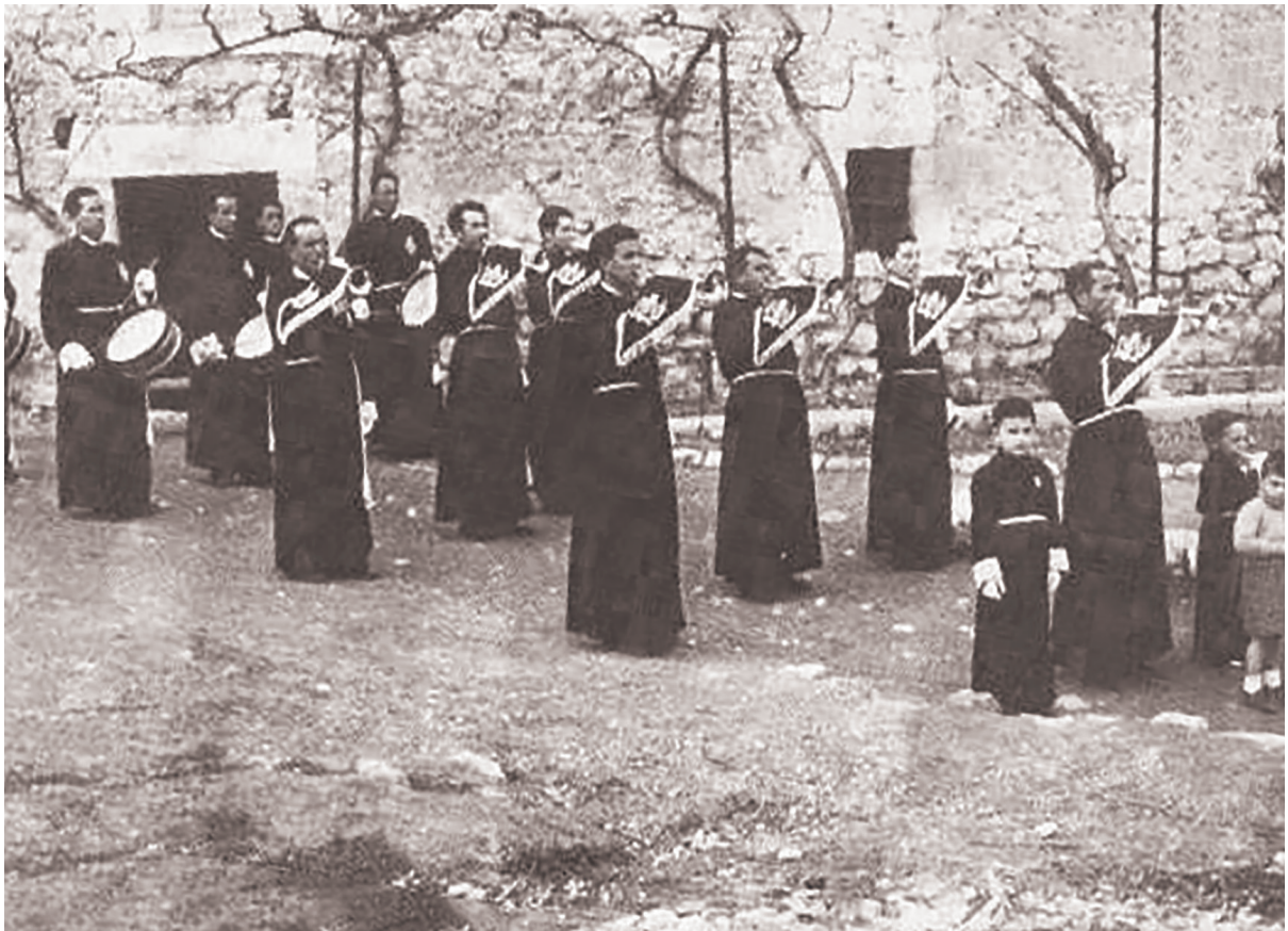
Ensayo de la Banda de Cornetas y Tambores de la Cofradía de la Pasión en el año 1951 , ensayaban en el patio del Convento de San Pablo, antiguo Alcázar de Alfonso X el Sabio y morada del infante Don Juan Manuel.